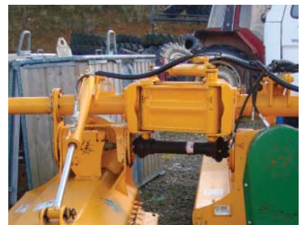
Extensible aumenta 140 kgs.