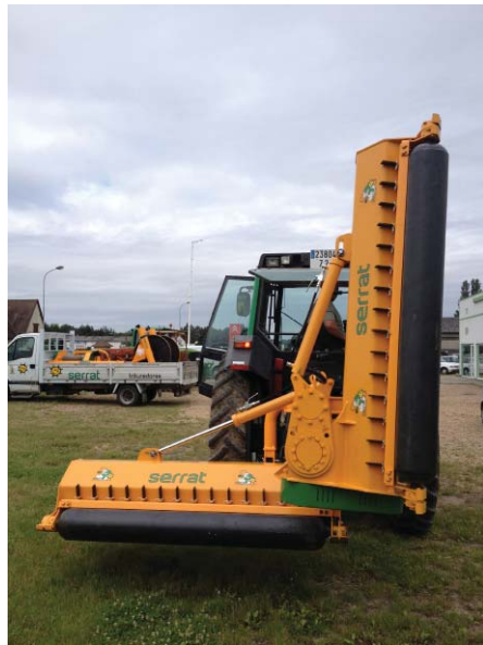
Auto plegado hidráulico