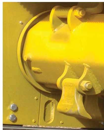
Obturaciones antialambres en rotor