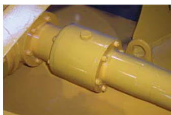
Rueda libre en la manga